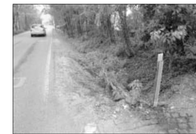
Incidente in via S. Bona Vecchia: ha perso la vita una donna di 77 anni di Silea

Il conducente perde il controllo dell'auto: anziana muore nello schianto in via Santa Bona